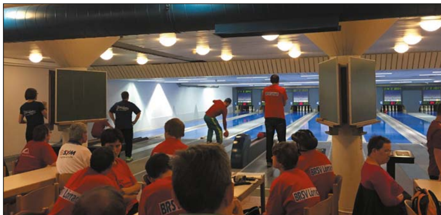
Voller Konzentration und Siegeswillen trugen die Mannschaften ihren Wettkampf aus.