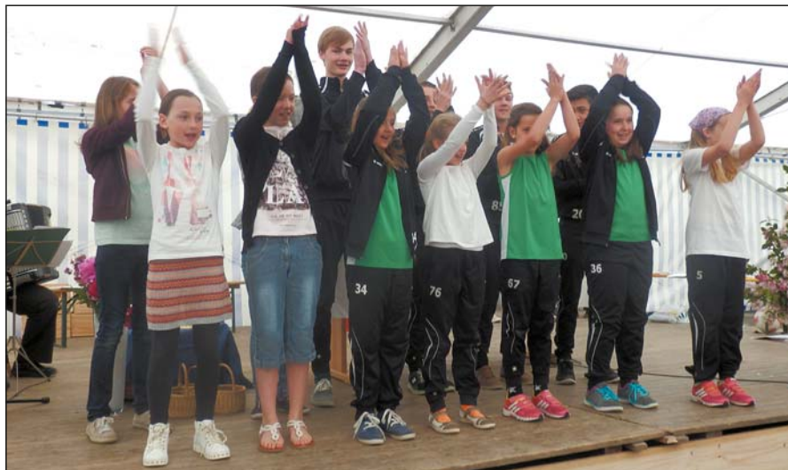
Beim Festgottesdienst im Zelt beim DJK-Pfingstsportfest ging es für die Gottesdienstbesucher auch darum, sich bei Liedtexten zu bewegen. Die DJK-Jugend machte es vor.