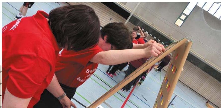
Der Spielparcours wurde auch in diesem Jahr wieder gut angenommen und die Teilnehmer sammelten eifrig Punkte an den vielen spannenden Stationen.