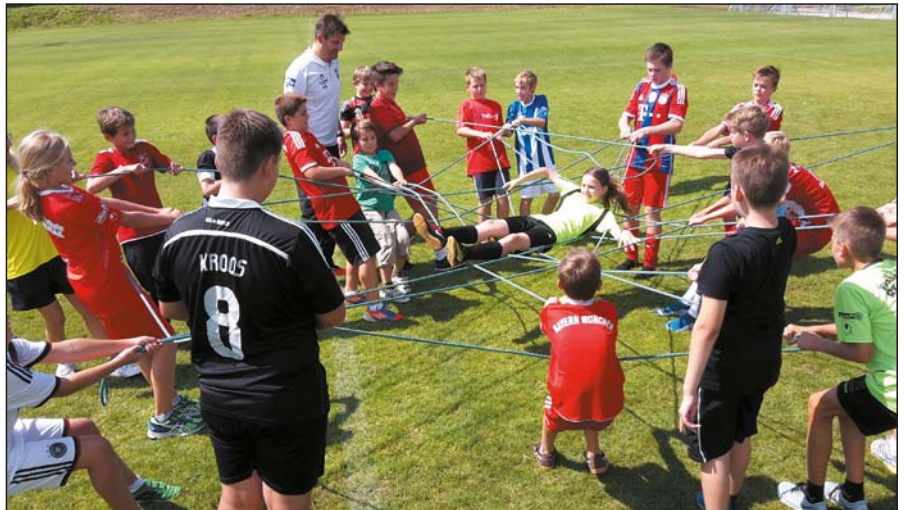
Sicher getragen im Netz der Mannschaft

Zunächst wurde der Frage nachgegangen, was ein Team ausmacht und was für ein gutes Miteinander in einer Mannschaft wichtig ist. Dabei wurden von den Kindern neben dem Zusammenhalt und der Gemeinschaft auch Vertrauen, Regeln und Disziplin sowie Respekt (z. B. „niemanden auslachen“) genannt. All dies sind nach Schreiners Worten wichtige Bausteine beim Bau eines „Team-Hauses“, damit sich letzt-