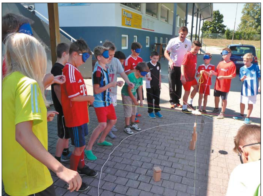
Turmbau zu Tiergarten-Haslach