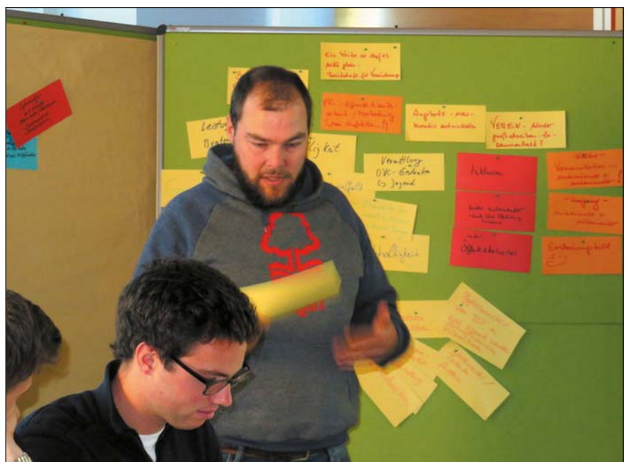
Intensiv wurde an den verschiedenen Aufgaben gearbeitet.