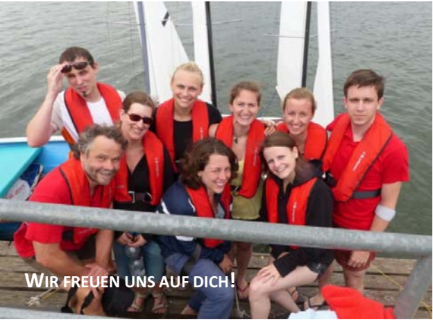
WIR FREUEN UNS AUF DICH!

Wenn wir dein Interesse geweckt haben und du einfach mal unverbindlich in unsere Arbeit reinschnuppern möchtest, dann melde dich gerne bei uns!