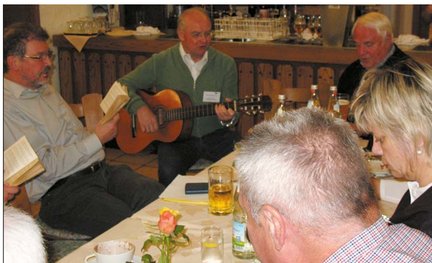
Beim gemütlichen Beisammensein