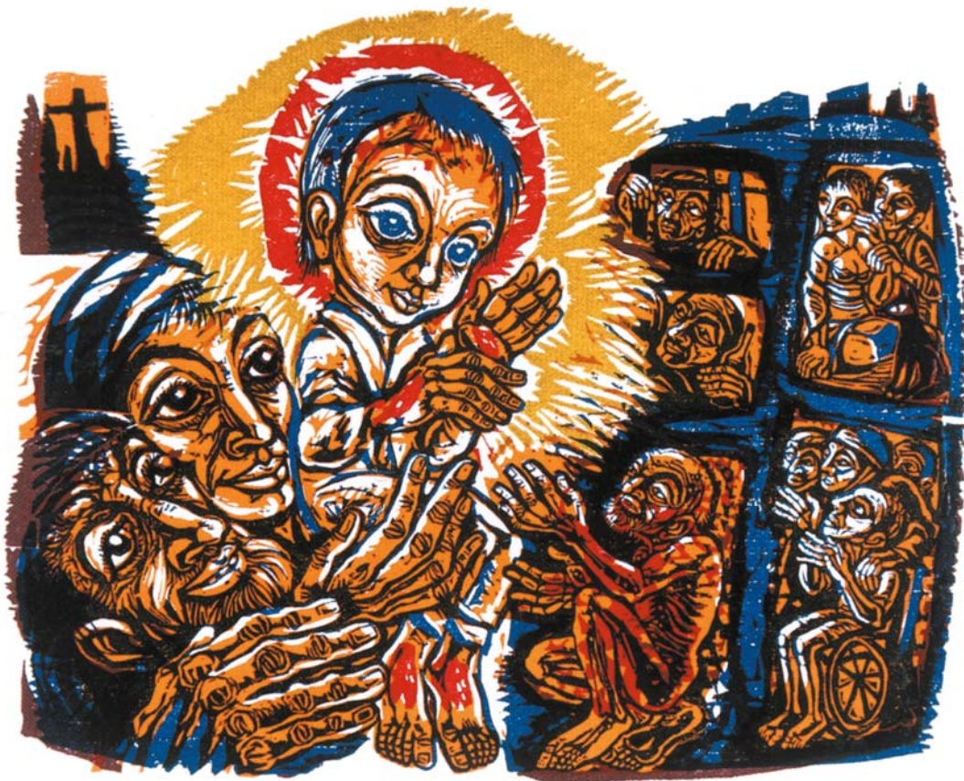
Walter Habdank „Licht in der Finsternis“ Holzschnitt 1976

Arbeitskreis besteht seit 50 Jahren S. 15