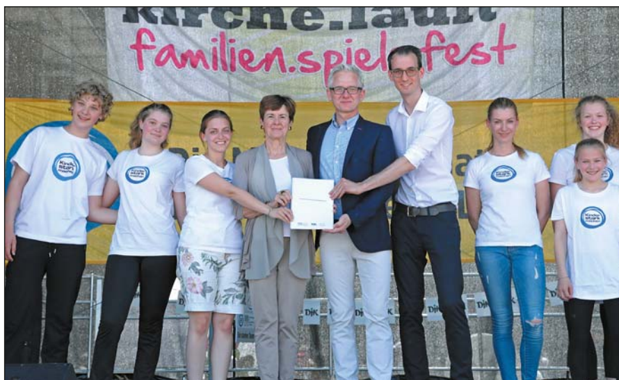
Bei der Vertragsunterzeichnung