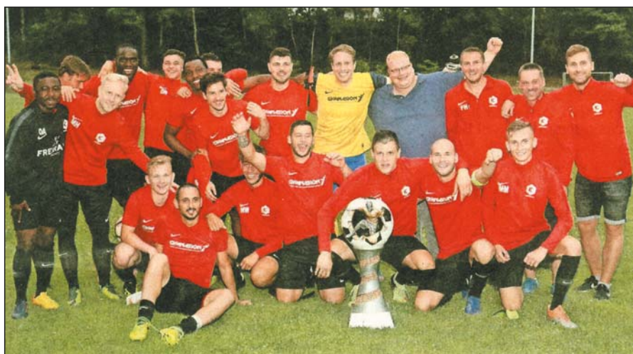
Jubel beim RSC/DJK: Im Elfmeterschießen zwingt der Bezirksligist den FV Ottersdorf mit 5:3 in die Knie.

In der Endrunde der Stadtmeisterschaften auf dem Gelände des RSC/DJK standen sich in den Halbfinalspielen Ottersdorf und Raental sowie der RSC/DJK und Frankonia gegenüber. Die Rieder schlugen Raental mit 4:3, die Gastgeber deklassierten die Frankonen mit 7:0. Im spannenden Finale gelang dem RSC/DJK erst in der Nachspielzeit der Ausgleich. Das Elfmeterschießen entschied der Titelverteidiger dann für sich - und durfte erneut den Cup nach Hause holen.